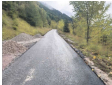
Der neue Belag im Mischwald zum Chobelrank

Ende Mai startete dann plangemäss die Firma Käppeli, die im hohen Tempo arbeitete, so dass es mit der Alpung und dem Hotel Schönhalden zu keinen grösseren Konflikten führte. Bis Mitte Juli waren die Tiefbauarbeiten erledigt, die geplanten Sommerferien konnten bezogen werden, bevor es Mitte September mit den Belagsarbeiten weiter ging. Wie geplant konnten die Hauptaufgaben im Herbst abgeschlossen werden, kleine Fertigstellungen werden im Frühjahr 2022 erledigt. Sehr erfreulich war, dass sich die Firma Käppeli