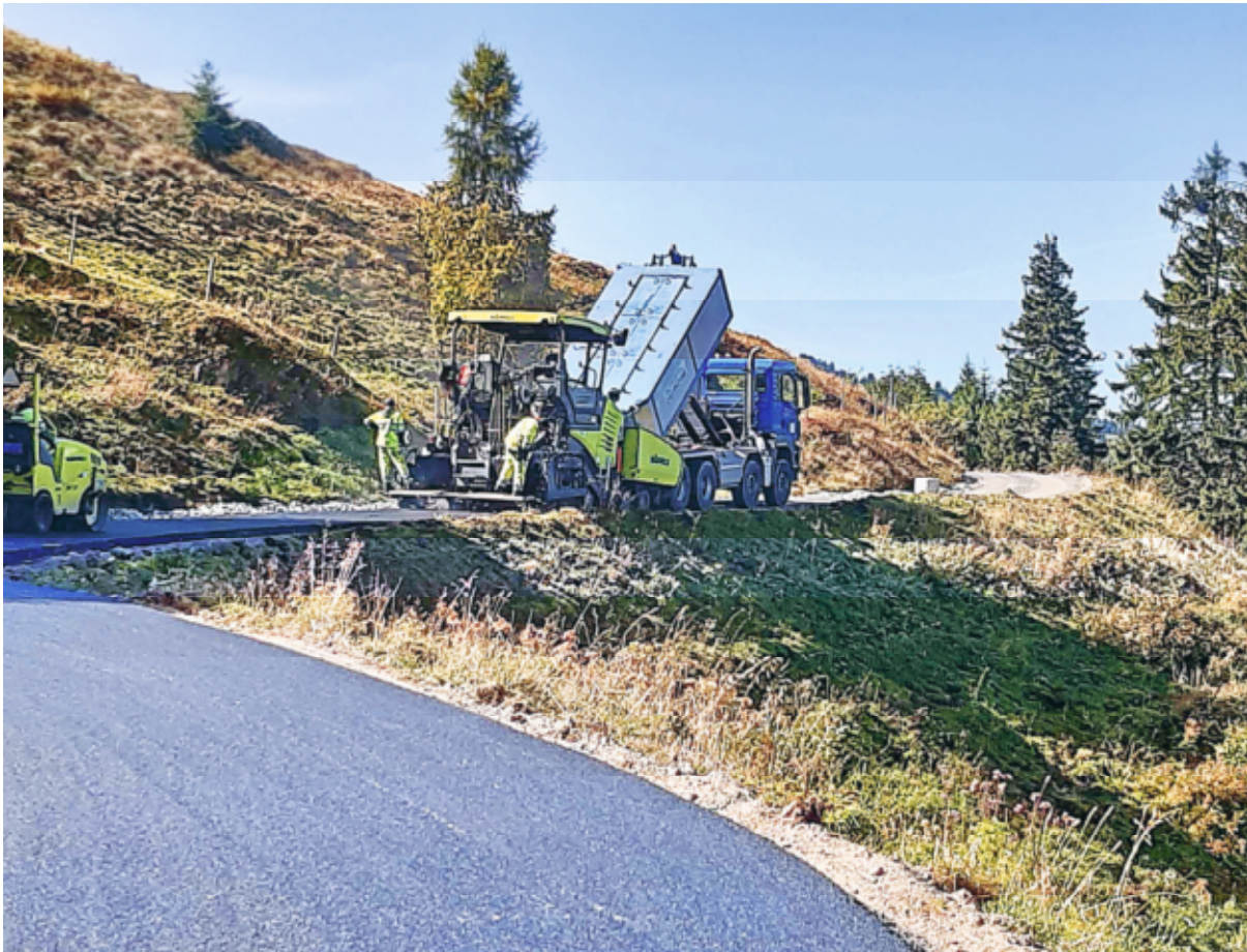
Strassensanierung Sässli - Schönhalden

Bürgerversammlung Freitag, 8. April 2022, 20.00 Uhr Hotel Gräpplang, Flums