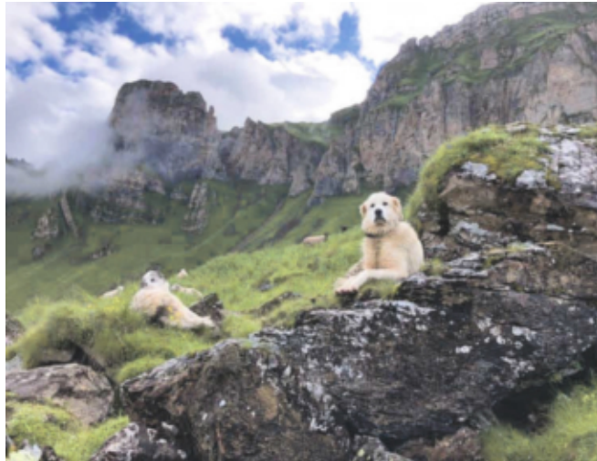
Die wachsamen Herdenschutz Hunde

Am 2. Juli 2021 stand die Klauenpflege auf dem Programm, anschliessend begaben wir uns mit den Schafen in die «Cheer». In der Nacht vom 8. Juli auf den 9. Juli 2021, fiel im «Ahörnli» eine Aue und ein Lamm dem Wolf zum Opfer. Zum Glück konnten die Herdenschutz Hunde Schlimmeres verhindern.