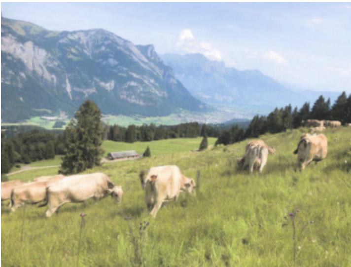
Weidegang der Melkkühe mit Aussicht

Der Regen und das kalte Wetter liessen einen zeitigen Alpaufzug wie in den vergangenen Jahren nicht zu, weshalb der Alpaufzug bei regnerischem Wetter am 07.06.2021 erfolgte. Es wurden 32 Milchkühe, 14 Galkühe und 9 schottische Hochlandrinder aufgetrieben. Ebenfalls wurden auf dem Heidenberg 13 Stück Vieh und ein paar Ziegen durch die Familie Bertsch aufgetrieben und über den Sommer betreut.