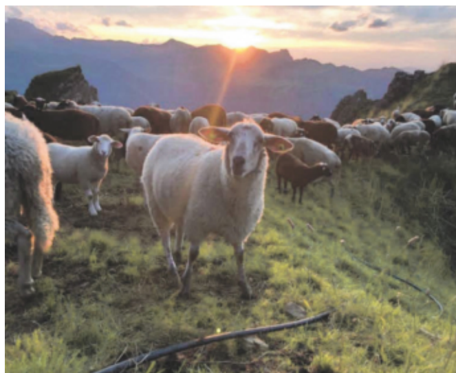
Schlussendlich spriest das Gras

Am 12. Juni 2021 konnte die Alp-Saison schlussendlich begonnen werden. An diesem Tag erhielten 642 Schafe vor dem Auftrieb, ein Klauen- und Räudebad sowie das Entwurmungsmittel bei Ignaz Müller. Vor dem grossen Auftrieb am 15. Juni 2021 ins «Ochsenälpli» verbrachten alle Schafe noch 3 Nächte auf der Vorweide.