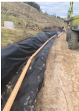
Die neue Strassenentwässerung

Ende Mai startete dann plangemäss die Firma Käppeli, die im hohen Tempo arbeitete, so dass es mit der Alpung und dem Hotel Schönhalden zu keinen grösseren Konflikten führte. Bis Mitte Juli waren die Tiefbauarbeiten erledigt, die geplanten Sommerferien konnten bezogen werden, bevor es Mitte September mit den Belagsarbeiten weiter ging. Wie geplant konnten die Hauptaufgaben im Herbst abgeschlossen werden, kleine Fertigstellungen werden im Frühjahr 2022 erledigt. Sehr erfreulich war, dass sich die Firma Käppeli