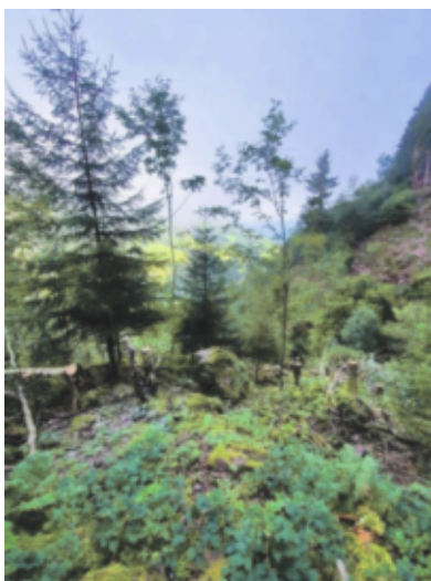
Nach der Pflege können Fichte + Ahorn wachsen

Bei der Jungwaldpflege erhöhten wir die geplante Fläche noch etwas und behandelten knapp 1000 Aren. An folgenden Orten wurde der Jungwald gepflegt: In den Stöcken 275 Aren Stangenholzpflege, im Gebiet Heizenris-Schmiedswerk 506 Aren Stangenholzpflege, oberhalb der Cher 103 Aren Stangenholzpflege und beim Ochsenälpli 110 Aren Stangenholzpflege. Die Arbeiten wurden von verschiedenen Forstunternehmern ausgeführt.