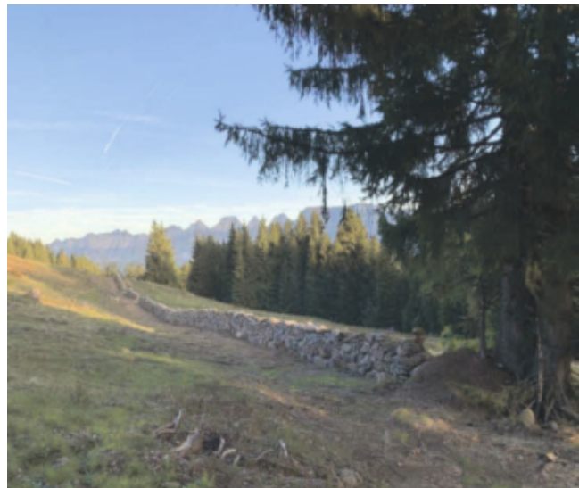
Dieser Ameisenhaufen hatte Vorrang

Der Startschuss fiel im Spätsommer 2020 und diente hauptsächlich der Vorbereitung der Arbeiten. So wurden die meisten Bäume entlang und auf der Mauer gefällt und fachgerecht entsorgt. Des Weiteren wurden Steine, die oberhalb und unterhalb auf der Weide lagen, als Ergänzung herbeigeschafft. Um eine Erfahrung über den Schwierigkeitsgrad des Baues zu sammeln, wurden als Abschluss noch rund 200 Laufmeter der Mauer erstellt. Petrus bescherte den Arbeitern beinahe traumhafte Bedingungen.