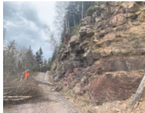
Felsräumung durch die Firma Gall

Das Strassenprojekt wurde unmittelbar nach der Urnenabstimmung Mitte Mai 2021 angepackt. Mit dem etwas verspäteten Frühling gab es vor Baubeginn noch eine Schneeräumung mit der Firma Gebr. Hermann AG, bevor der eigentliche Startschuss fallen konnte. Schlag auf Schlag packte erst die Firma Gall Forst AG, 8892 Berschis, die Felsräumung an. Diese wurde begleitet durch das Büro Impergeologie AG, 8888 Heiligkreuz.