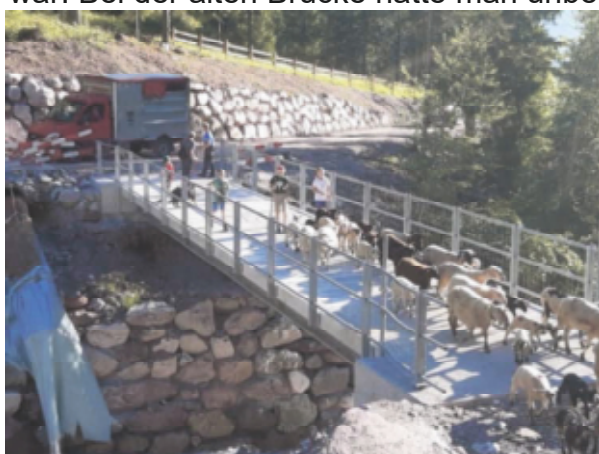
Die neue Ochsenälplibrücke

Die unerwartete und nicht geplante Anfrage der SAK über eine Mitfinanzierung der Ochsenälplibrücke machte uns erst grosse Sorgen. Doch nach verschiedenen Abklärungen gab die Ortsgemeinde Flums-Kleinberg im November 2020 grünes Licht für eine mögliche Mitfinanzierung des Brückenbaus. Zu diesem Zeitpunkt war der grösste Teil der Finanzierung gesichert. Die alte Brücke hätte vermutlich noch ein paar Jahre ihren Zweck erfüllt, obwohl sie an gewissen Stellen etwas geschwächt war. Bei der alten Brücke hätte man unbedingt das Gelände erneuern müssen, dies