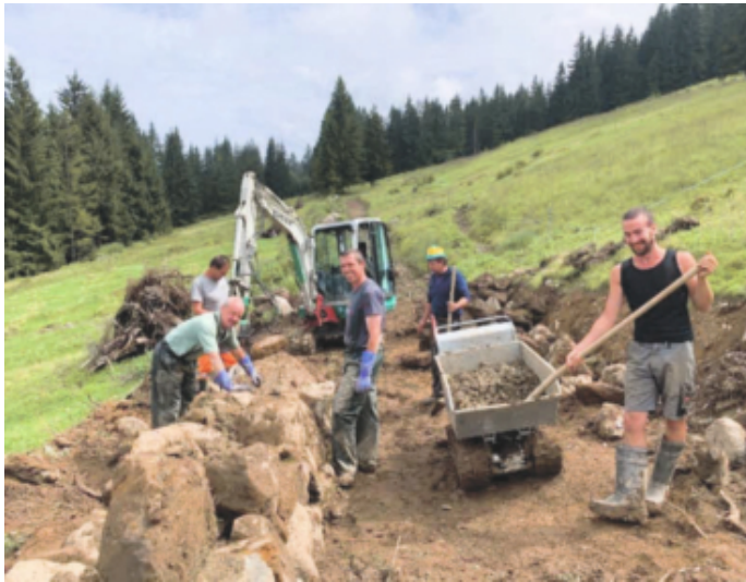
Saniertes Mauerstück mit zum Teil bemoosten Steinen

Diese ist rund 530 m lang und trennt die beiden Alpen Wildenberg und Gafröen. Ein Wanderweg zwischen dem Berghotel Schönalden und der Alp Gafröen kreuzt diese