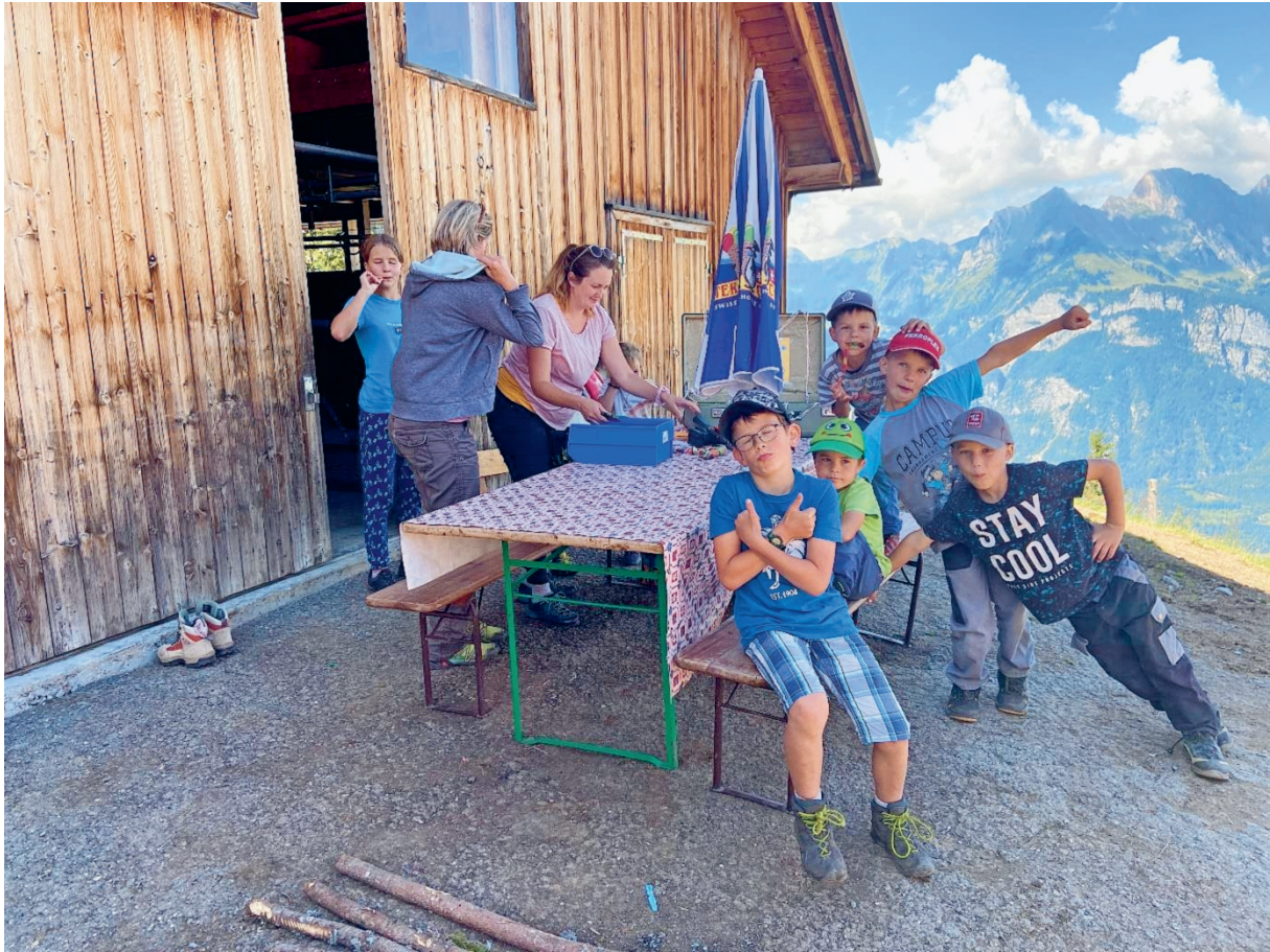
Fröhliche Kinder am Bürgertag