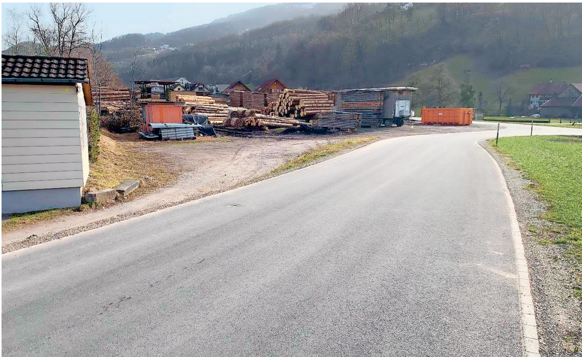
Zentralenstandort des Wärmeverbundes Schälli

Geplant sind Hauptleitungen für einen Warmwasserkreislauf vonseiten der Betreiberin sowie individuelle Anschlusslösungen in den einzelnen Häusern auch unter Beizug des Fachgewerbes. Das Projekt geht bei einer Mindest-Vorvertragsanzahl von 500 Kilowatt in die Detailplanung. Aufgrund des starken Interesses an der Informationsveranstaltung vom 1. Dezember 2022 sind die BGS und die drei Ortsgemeinden sehr optimistisch bezgl. der Umsetzung.