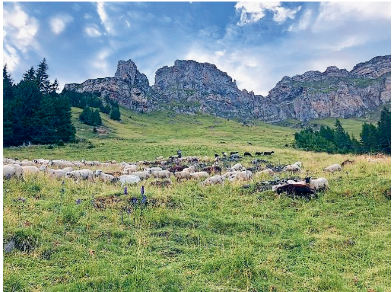
Schafe auf der Alp Halden

Dieses Jahr startete die Alpsaison am 28. Mai 2022 mit 671 Schafen. Die Schafe genossen auf den verschiedenen Alpwiesen das Gras und die verschiedenen frischen Kräuter. Leider kreuzte immer wieder ein Wolfspaar den Weg der Schafe, was zu zwölf Wolfrissen führte. Die Behörden vom Kanton, gaben einen der beiden Wölfe zum Abschuss frei. Leider konnte er in der vorgegebenen Frist von 60 Tagen nicht erlegt werden.