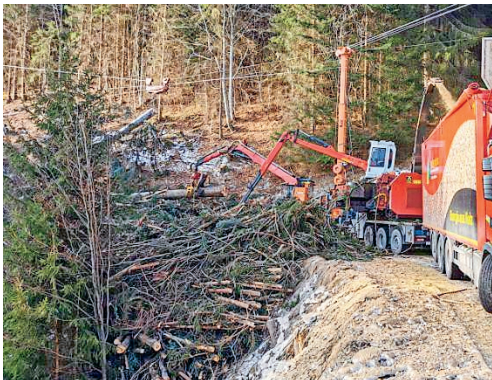
Aufbereitung der Holzhackschnitzel