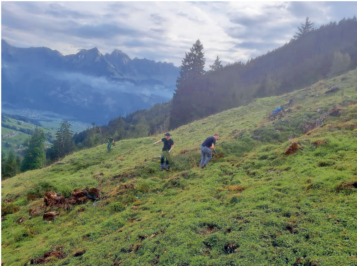
Arbeitstag mit dem Chapfensee-Club Chobel