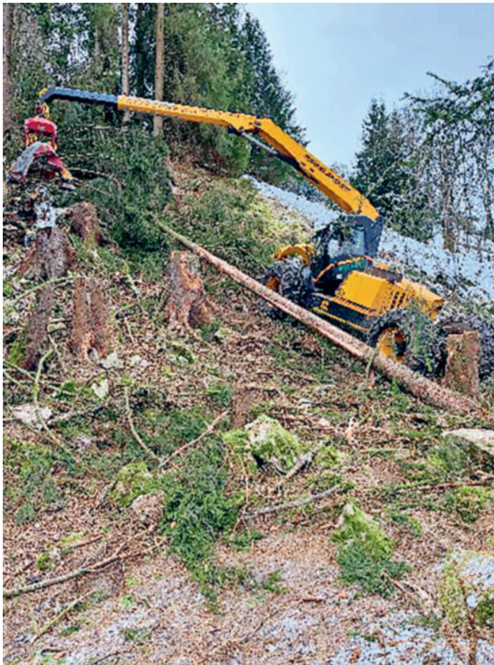
Einsatz mit schwerem Gerät

Im Frühjahr führte man, zusammen mit der Ortsgemeinde Flums-Dorf, auch noch einen kleinen Holzschlag (100 fm) oberhalb Sässli aus. Im Herbst wurde im Bereich Egg-Goldiger Rank nochmals ein kleinerer Holzschlag ausgeführt. Es wurden rund 130 m 3 genutzt und die Nutzungen dienten vorwiegend der Sicherheit der Strasse. Es wurden etliche dürre Eschen und Erlen gefällt. Gegen Ende Jahr wurde der schon mehrmals verschobene Holzschlag im Bereich Marmatsch-Egg noch ausgeführt. Zusammen mit der Swissgrid AG konnten die Holzerei- und Seilbahnarbeiten noch im Jahr 2022 ausgeführt werden. Aus Sicherheitsgründen gegenüber der Hochspannungsleitung, musste schweres Gerät eingesetzt werden.