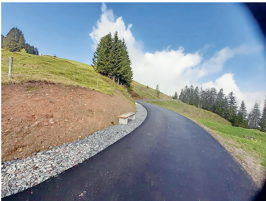
Ein neuer Abschnitt der Schönhalden- strasse

Insgesamt konnte der Kostenrahmen gemäss Kostenvoranschlag vom 9. September 2020 eingehalten werden. Die abgerechneten Totalkosten für die Sanierung Schönhaldenstrasse Abschnitt «Wisrüfi - Schönhalden» sowie das Verkehrs- und Parkplatzregime und die Massnahmen in der Wisrüfi liegen bei Fr. 573'781.40 inkl. MwSt. Die Sanierung Schönhaldenstrasse konnte so mit Minderkosten gegenüber dem Kostenvoranschlag von rund 14% abgeschlossen werden.