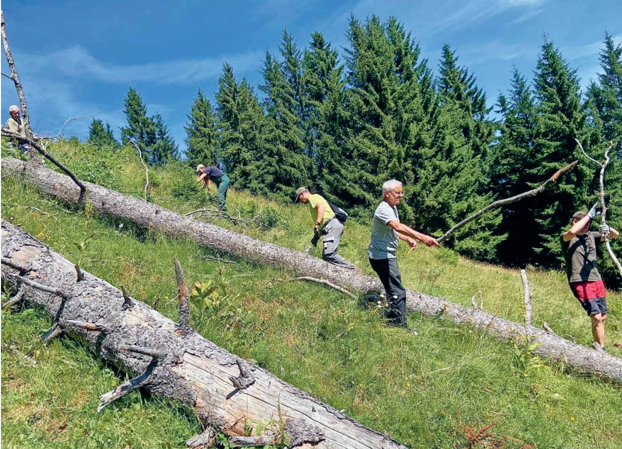
Fleissige Helfer am Bürgertag