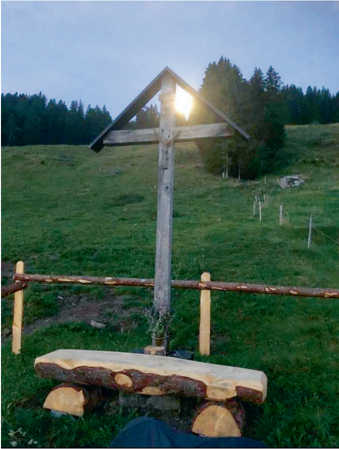
Neue Sitzbank auf der Alp Gafröen