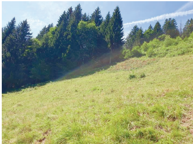
Weidepflege auf dem Heidenberg

Noch vor dem Alpaufzug wurden die ersten Weideunterhaltsarbeiten durch die Bestösser in Angriff genommen. Die Weiden wurden von Büschen befreit und angrenzende Waldränder zurückgeschnitten. Das angefallene Astmaterial wurde später durch eine Schulklasse aus dem Dorf verbrannt.