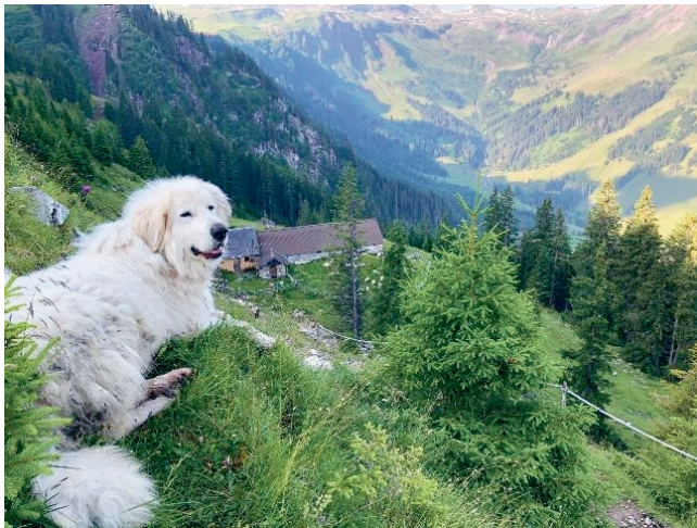
Ein wachsamer Herdenschutzhund

Unser Hirt Urs Brechbühl gab nach 5 Jahren seinen Rücktritt als Hirt bekannt. Ein grosses Dankeschön an Urs, für seinen Einsatz und Arbeit auf der Alp. Für die Zukunft wünschen wir ihm alles Gute!