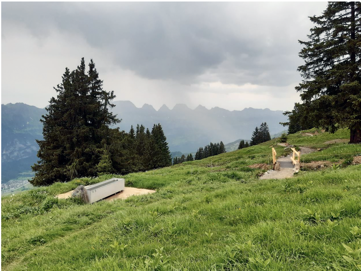
Die Wanderwegsanierung zwischen Schönhalde und Stutz