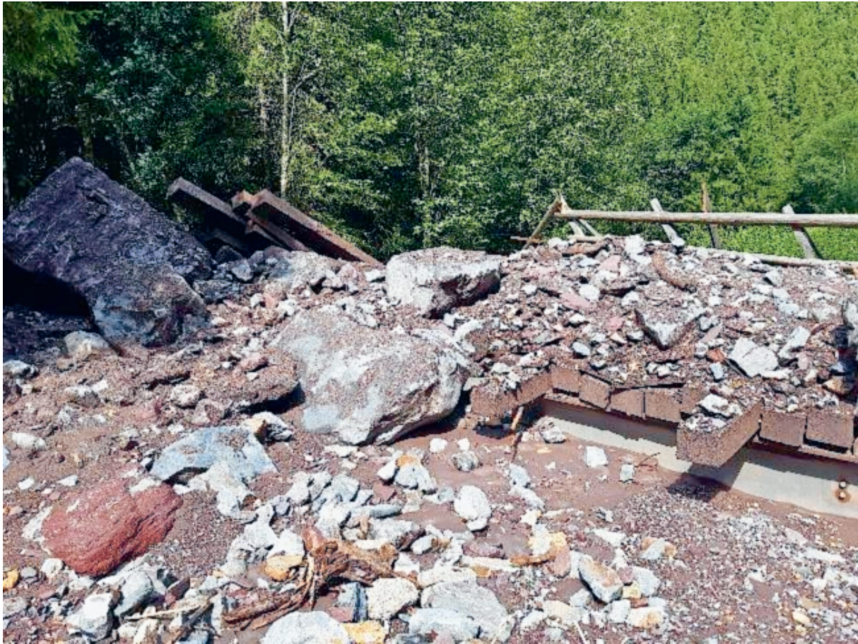
Unwetter vom 28. Juli 2022; Brücke beim Rindergatter