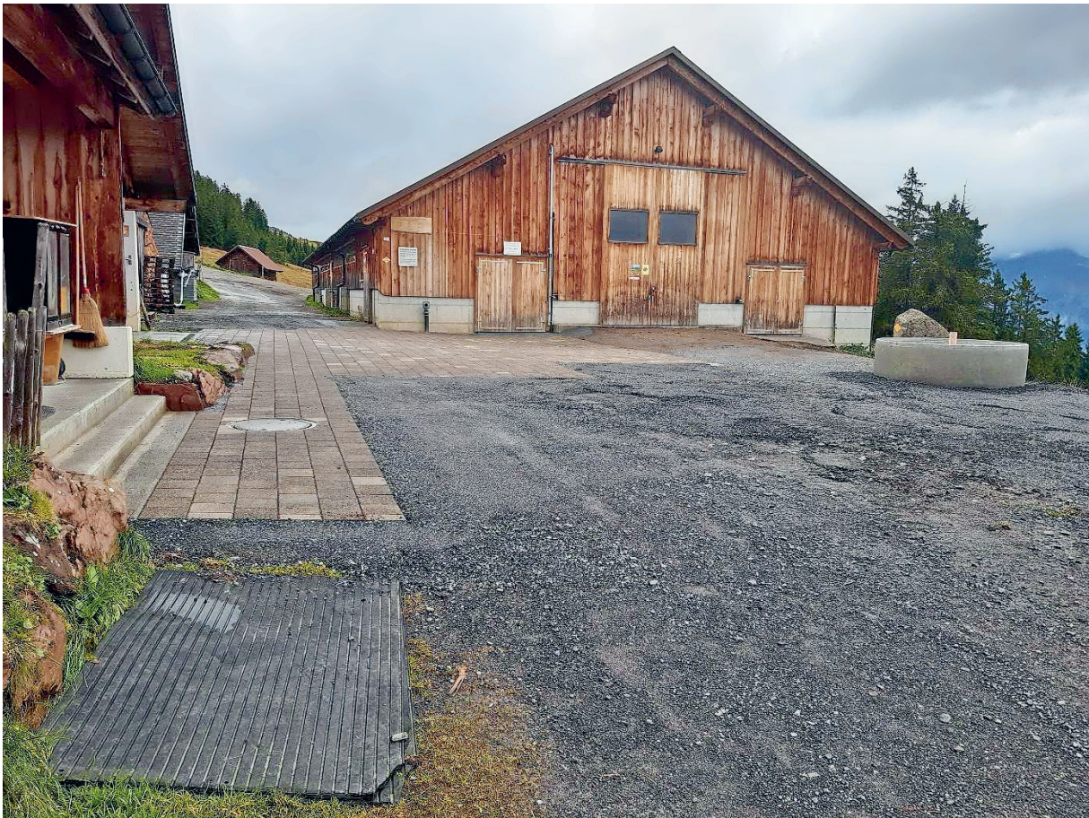
Erster Teil der Vorplatzsanierung Wildenberg

Vorgesehen ist die Fortsetzung, der im letzten Jahr geplanten und zum Teil umgesetzten, Vorplatzsanierung der Alp Wildenberg im Rohbau fertig zu stellen, damit die in Aussicht gestellten Belagsarbeiten allenfalls im nächsten Jahr realisiert werden könnten.