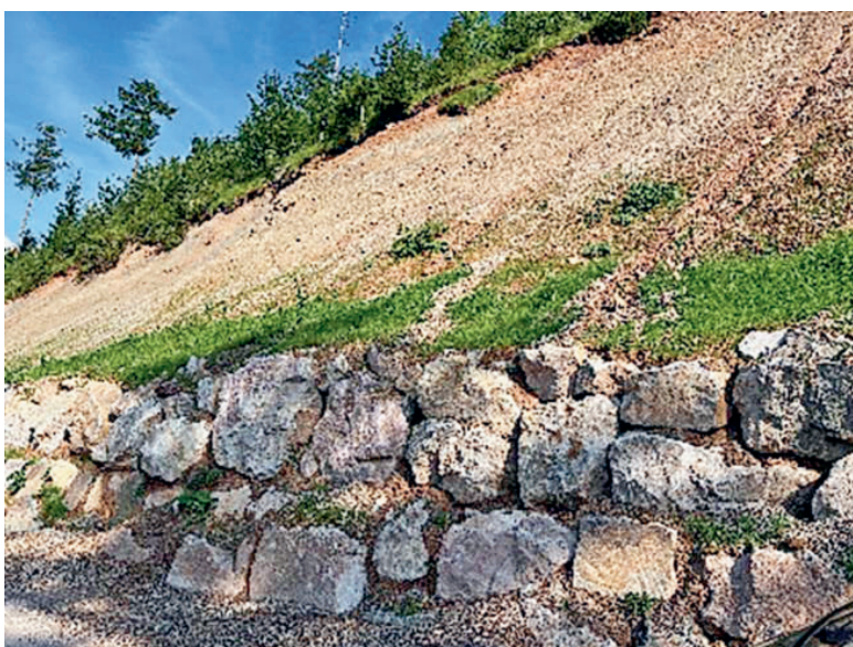
Bruchsteinmauer mit Begrünung

An Zwangsnutzungen fiel etwas Schneebruch- und Käferholz an im Umfang von 150 fm oberhalb Sässli und 50 fm verteilt auf ein grösseres Gebiet. Es wurde zeitnah genutzt und so eine Weiterverbreitung des Borkenkäfers verhindert.