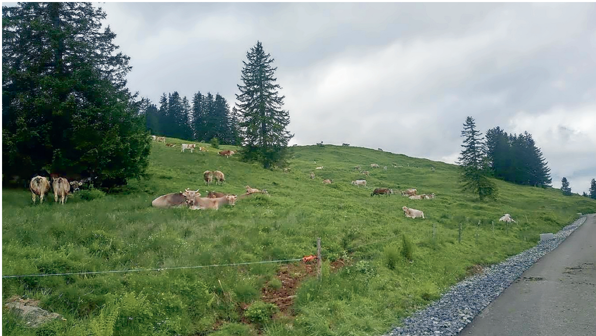
Kühe auf der Weide