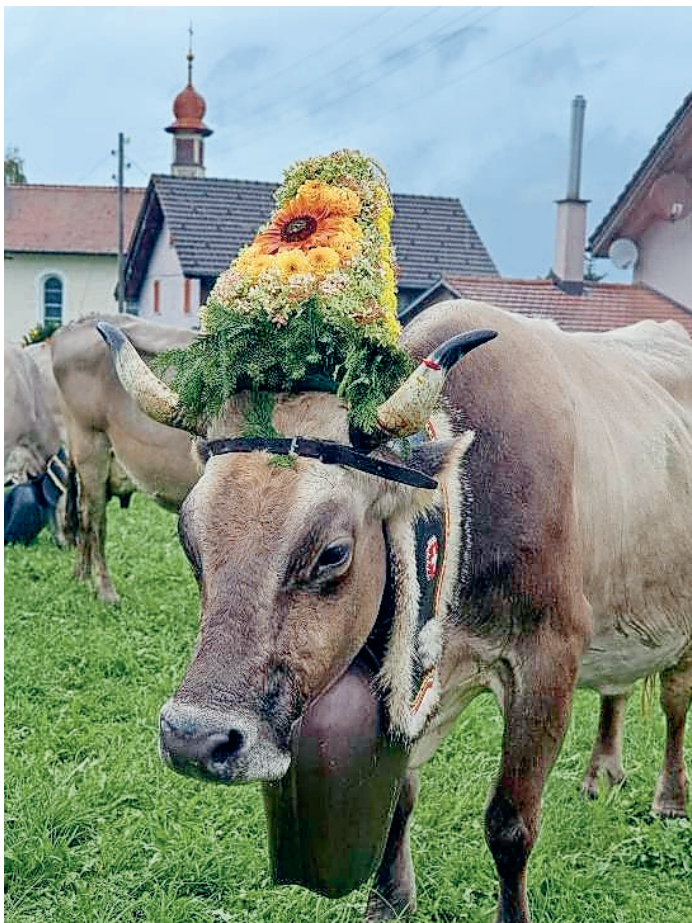
Alpabfahrt Gafröen 2022

Ein Highlight dieses Jahr war mit Sicherheit auch der angestrebte Weltrekordversuch des grössten Alpkäses der Welt. Im Rahmen des 150-jährigen Jubiläums des Sarganserländers wurde die Produktion eines Grosskäses auf der Alp Tannenboden umgesetzt. Ob der Weltrekord gelungen ist, wird an der Siga 2023 entschieden.